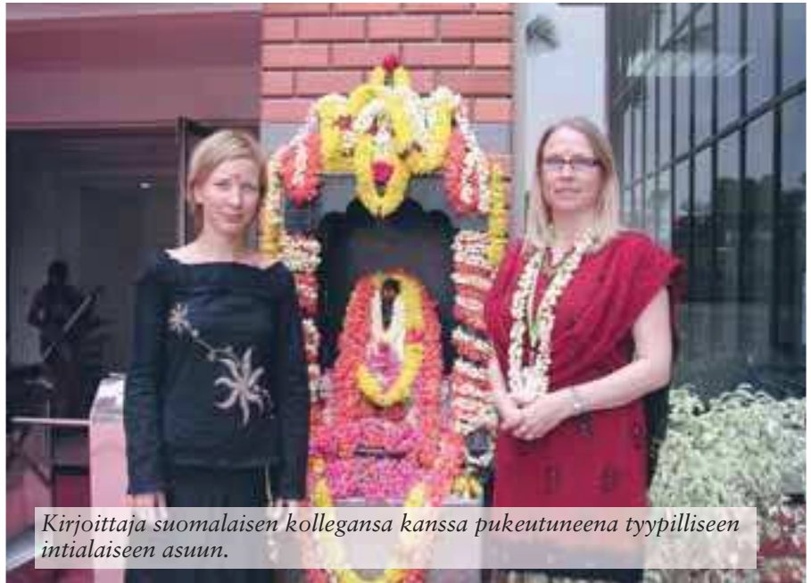
Kirjoittaja suomalaisen kollegansa kanssa pukeutuneena tyypilliseen intialaiseen asuun.

Kaupungeissa ja ylempien kastien naisten koulutustaso on noussut ja naiset käyvät yhä enemmän kodin ulkopuolella töissä vaikkakin joutuvat vielä usein avioiduttuaan jäämään kotiin tai muuttamaan miehen työn perässä toiselle paikkakunnal-