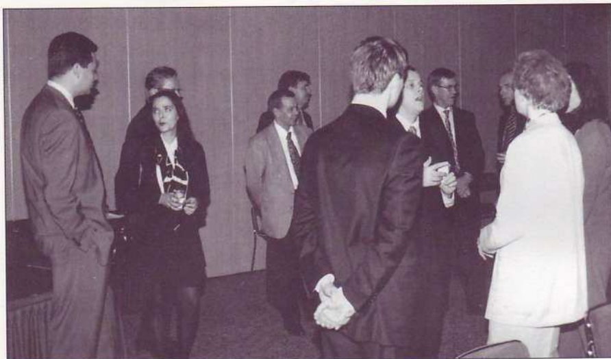
Käytäväkeskustelut ovat yhtä mielenkiintoisia kuin kokouskin.

Kokouksen päätyttyä kokousväki siirtyi maittavalle illalliselle ravintola Fransmanniin.